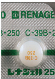
レナジェル、フォスブロック (塩酸セベラマー)

【用法】食直前～食中～食直後 【作用】胃酸によりイオン化されリンを吸着 【特徴】PHが6以上での吸収効果の減弱→胃酸を押さえる薬（ファモチジン、タケプロン、オメプラール、パリエット）は服用時間を離します 【注意】空腹時に服用すると、血清Ca値の上昇を招き、異所性石灰化、無形成骨症を起こしやすくなります