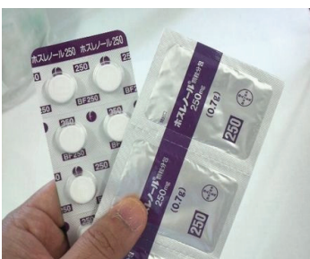
ホスレノールチュアブル250 ホスレノール顆粒 (炭酸ランタン)

【用法】食直前～食中～食直後 【作用】カルシウムを含まないリン吸着薬です。 リン結合性ポリマー（陰イオン交換樹脂）→リン吸着 胆汁酸と結合→コレステロールを低下 【注意】陰イオン交換樹脂（不溶性）なので腸内の水分を吸収すると膨潤、腹部膨満や硬結便になりやすい。 脂溶性ビタミン(A、D、E、K)あるいは葉酸塩の吸収阻害