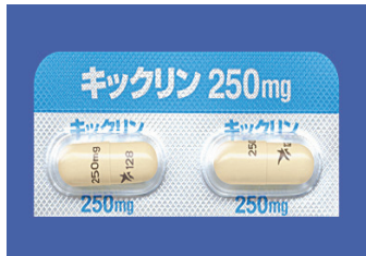
キックリン250 (ビキサロマー)

【用法】 食直前～食中～食直後 【作用】 カルシウムを含まないリン吸着薬です。 非吸収性のアミン機能性ポリマー→リン吸着 【特徴】 膨潤の程度が小さく腹部膨満や便秘など消化器系の副作用が少ないと言われています 胆汁酸の吸着能が低く、ビタミンの吸収障害を生じる可能性も低い