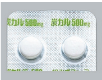
炭カル錠、沈降炭酸カルシウム

【用法】食直前～食中～食直後 【作用】胃酸によりイオン化されリンを吸着 【特徴】PHが6以上での吸収効果の減弱→胃酸を押さえる薬（ファモチジン、タケプロン、オメプラール、パリエット）は服用時間を離します 【注意】空腹時に服用すると、血清Ca値の上昇を招き、異所性石灰化、無形成骨症を起こしやすくなります